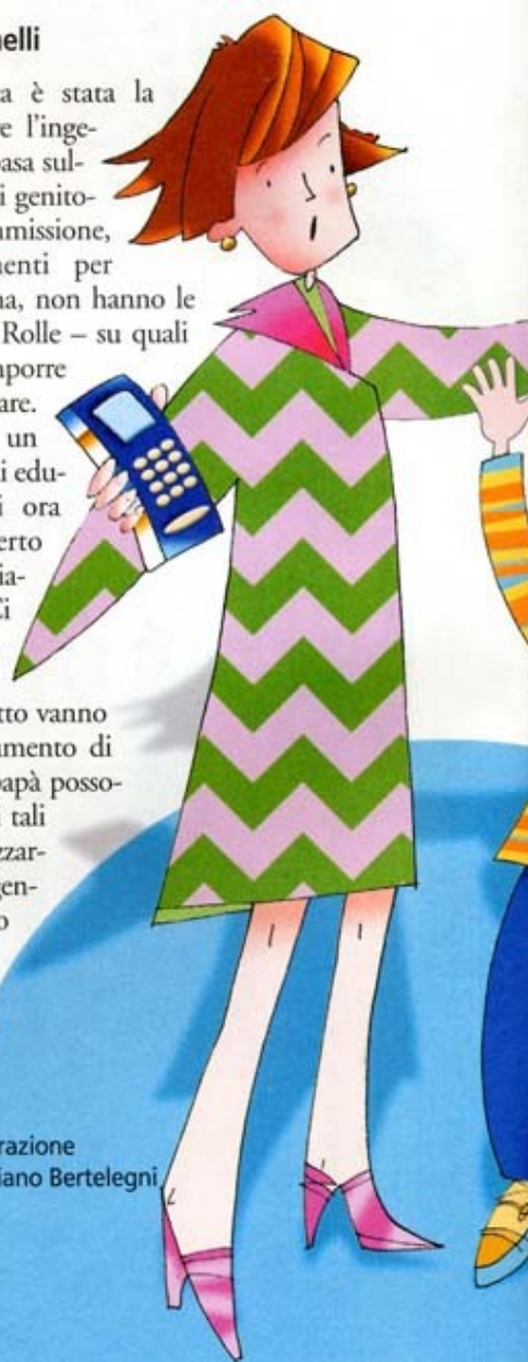
Illustrazione Graziano Bertelegni

Come spesso capita è stata la necessità ad aguzzare l'ingegno: «Il progetto si basa sulla constatazione che i genitori, per loro stessa ammissione, non hanno strumenti per affrontare il problema, non hanno le idee chiare – spiega Rolle – su quali siano le regole da imporre per l'uso del cellulare. Grazie al lavoro di un gruppo di genitori, di educatori e di ragazzi ora quelle regole, certo suscettibili di cambiamenti, ci sono». Ci tiene a precisare, don Ilario, che quei punti messi per iscritto vanno considerati uno strumento di lavoro, «mamma e papà possono decidere di usarli tali e quali ma personalizzarli piegandoli alle esigenze familiari è persino più proficuo». Perché – continua Rolle – «aprire la discussione con i ragazzi, parlare del problema, indurli a ragionare su cosa si può